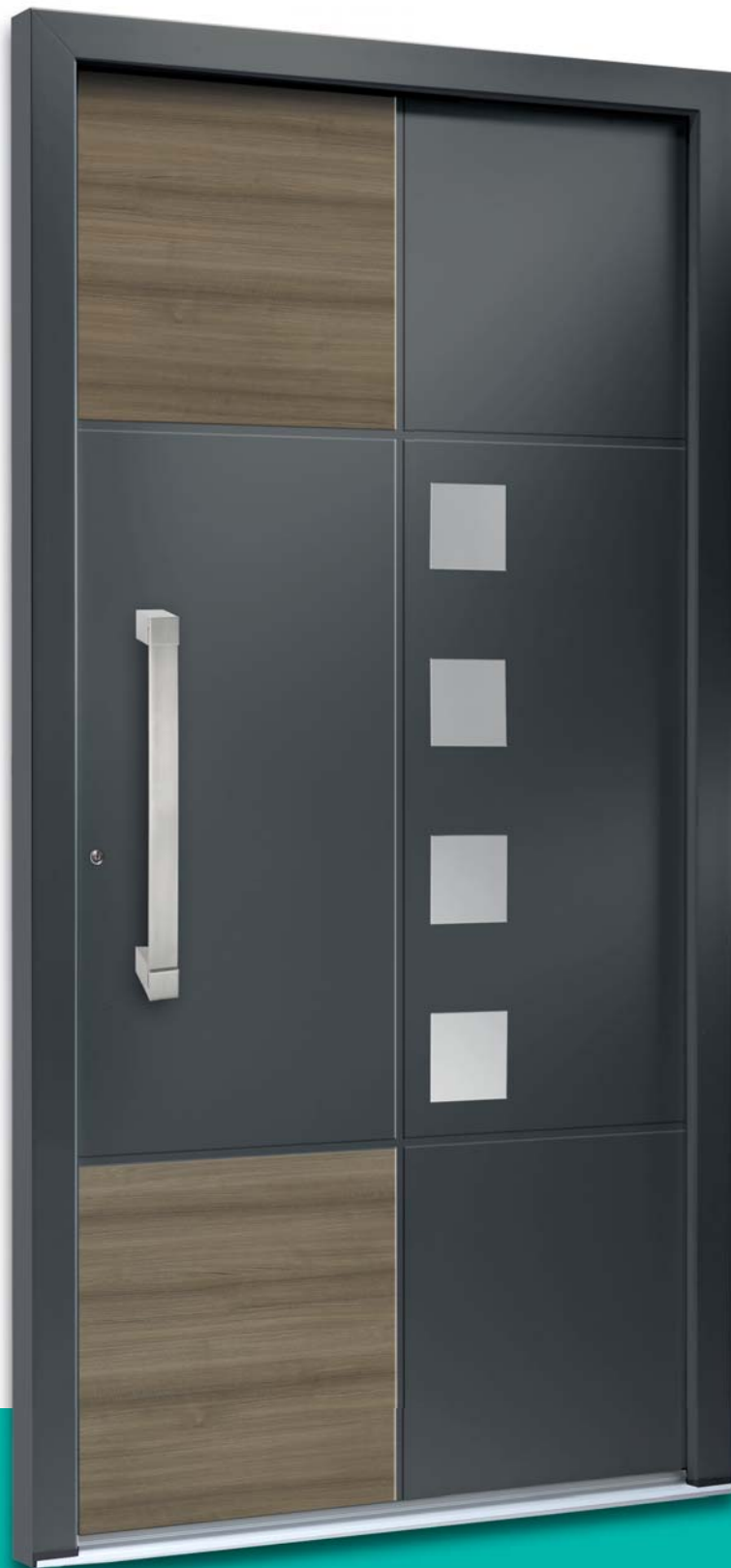
Modell TR_6195-58 | Designfelder: Dekor AnTeak querfurniert | Extras: Aufsatzfüllung | RAL 7012 basaltgrau | Glas Satinato weiß | Griff: 1025-13 Edelstahl, integriert