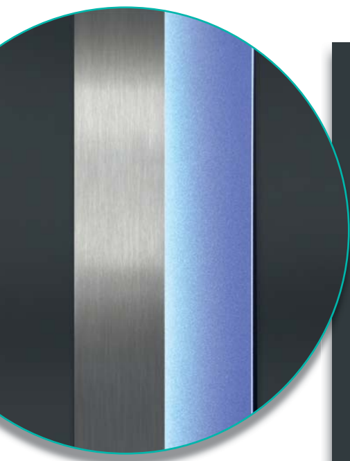
| Detail | integriertes Griffelement mit LED-Beleuchtung