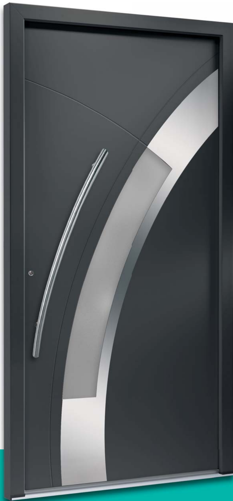
Modell TR_6438-56 Applikation – Edelstahl-Design flächenbündig | Extras: Aufsatzfüllung | RAL 7016 anthrazitgrau | Glas Satinato weiß | integrierter Edelstahl-Designgriff V 78