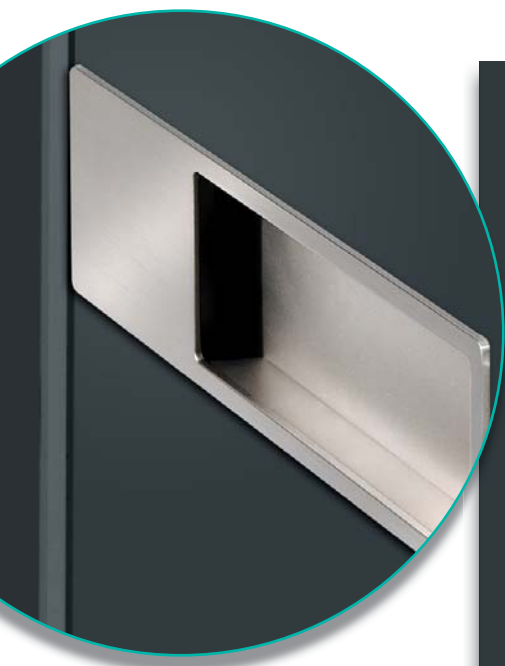
| Detail | Edelstahl Griffschale V 103