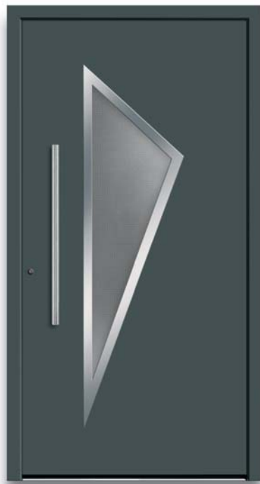
Modell TR 49-70