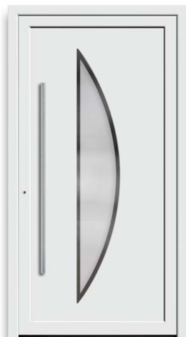
Modell TR 47-50

B Modell TR 47-70 | Rahmen-Edelstahloptik Verglasung: G 1312 mattiertes Glas mit klaren Streifen | Farbe: RAL 3004 purpurrot | Aufsatzfüllung | Mit 1600 mm Edelstahl-Stangengriff