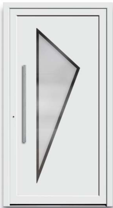
Modell TR 49-50