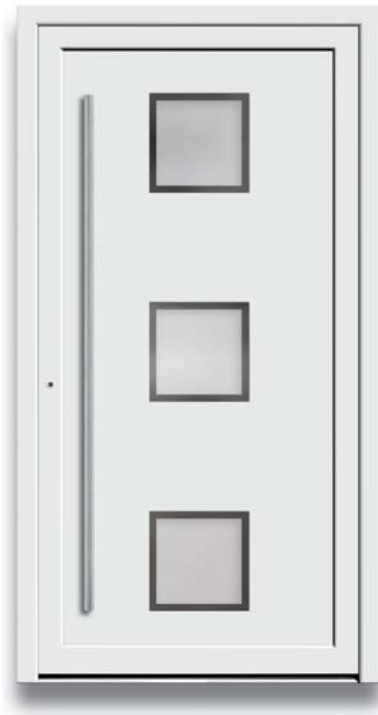
Modell TR 46-50

B Modell TR 46-70 | Rahmen-Edelstahloptik Verglasung: Satinato weiß | Farbe: RAL 7035 lichtgrau | Aufsatzfüllung | Mit 1600 mm Edelstahl-Stangengriff