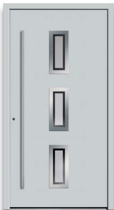
Modell TR 45-70

E Modell TR 42-70 | Rahmen-Edelstahloptik Verglasung: G 505-25 mattiertes Glas mit klarem Rand | Farbe: RAL 7012 basaltgrau | Aufsatzfüllung | Mit 800 mm Edelstahl-Stangengriff