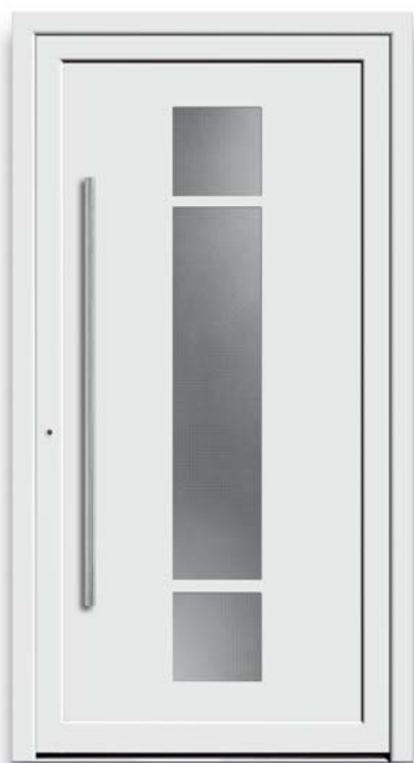
Modell TR 42-50