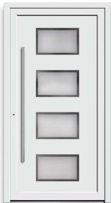
Modell TR 50-50