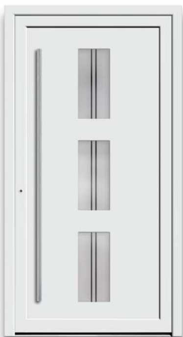
Modell TR 45-50