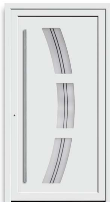
Modell TR 48-50