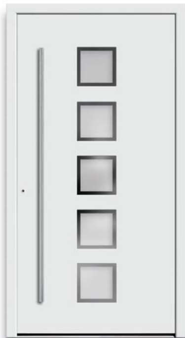
Modell TR 44-50