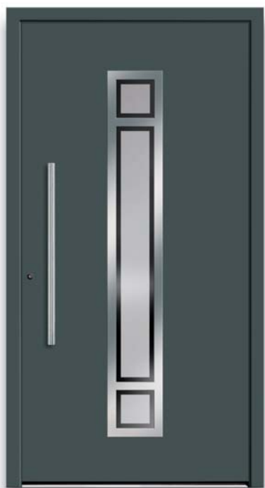
Modell TR 42-70