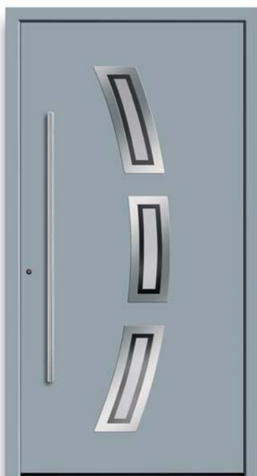
Modell TR 48-70

D Modell TR 48-50 | Verglasung: G 1310 mattiertes Glas mit klaren Streifen | Mit 1600 mm Edelstahl-Stangengriff