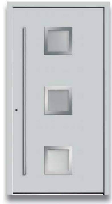
Modell TR 46-70