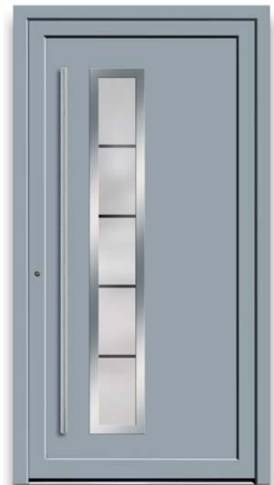
Modell TR 41-70