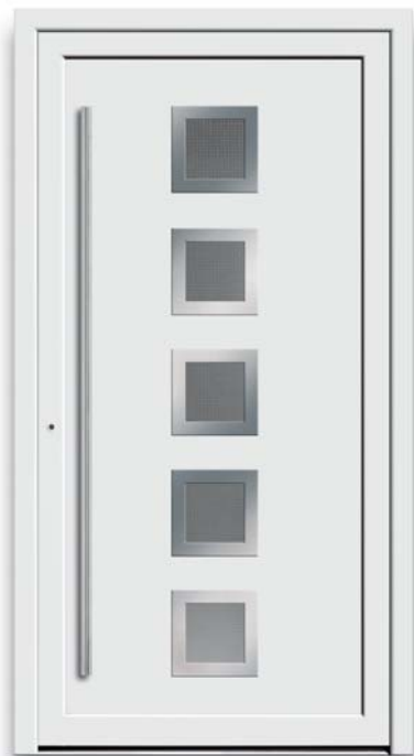
Modell TR 44-70