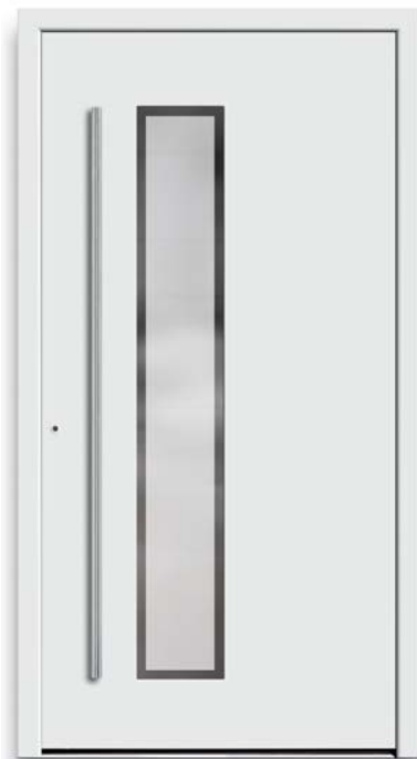
Modell TR 41-50

Modell TR 40-70 | Rahmen-Edelstahloptik Verglasung: G 500-25 mattiertes Glas mit klarem Rand | Farbe: RAL 7016 anthrazitgrau | Aufsatzfüllung | Mit 1600 mm Edelstahl-Stangengriff