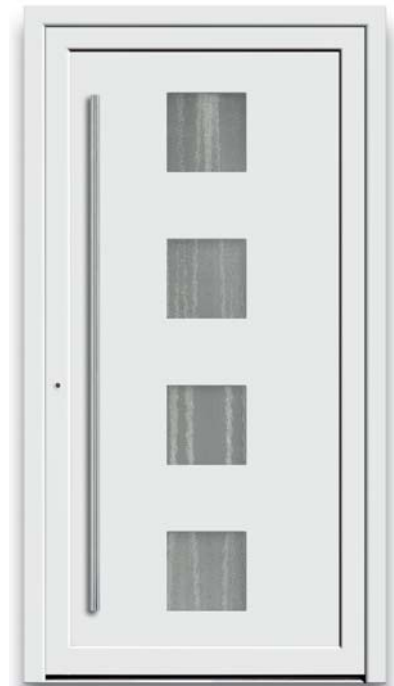
Modell TR 43-50