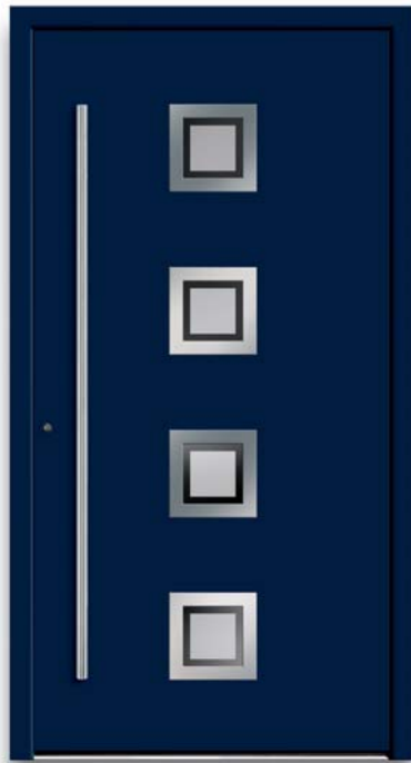
Modell TR 43-70

D Modell TR 43-50 | Verglasung: Chinchilla weiß | Mit 1600 mm Edelstahl-Stangengriff