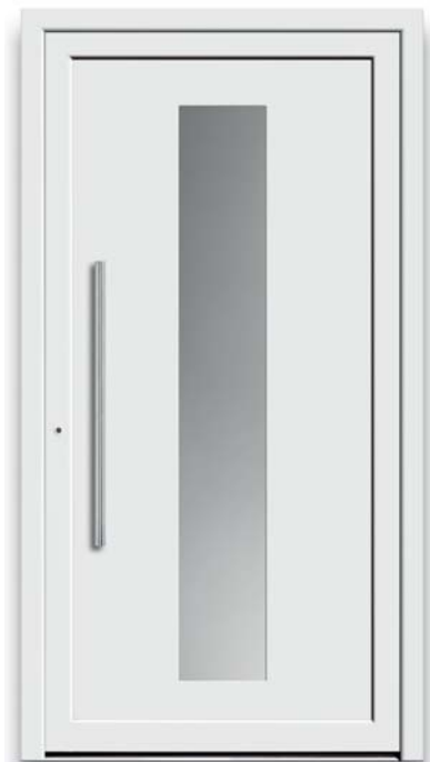
Modell TR 40-50